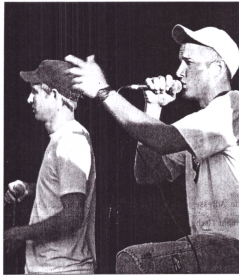
Die „Kings-Brothers“ fühlten sich als Exoten – sie waren der einzige Hip-Hop-Act beim Festival.

„Chillen“ war also nicht durchgängig angesagt. Stress