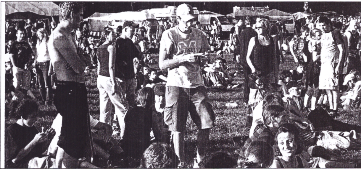
Strahlender Sonnenschein, relaxte Atmosphäre und gute Musik: Die Festivalbesucher ließen es sich auf der Wiese vor der Nu Stage gutgehen.